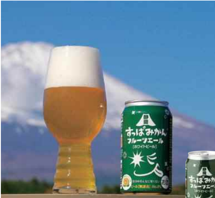
内容量:350ml/小売価格:418円(税込)/賞味期限:製造から12ヶ月/保存方法:常温/販売期間:2024年9月より数量限定販売中(2025年の再販も予定)

【すっぱみかん×FUJI PREMIUM BREWING】MADE IN 静岡のフルーツエール