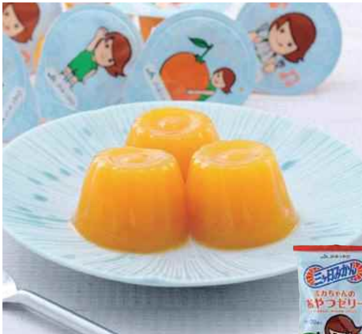
内容量：22g×30個入り／オープン価格／賞味期限：製造から6ヶ月／保存方法：常温／販売期間：通年