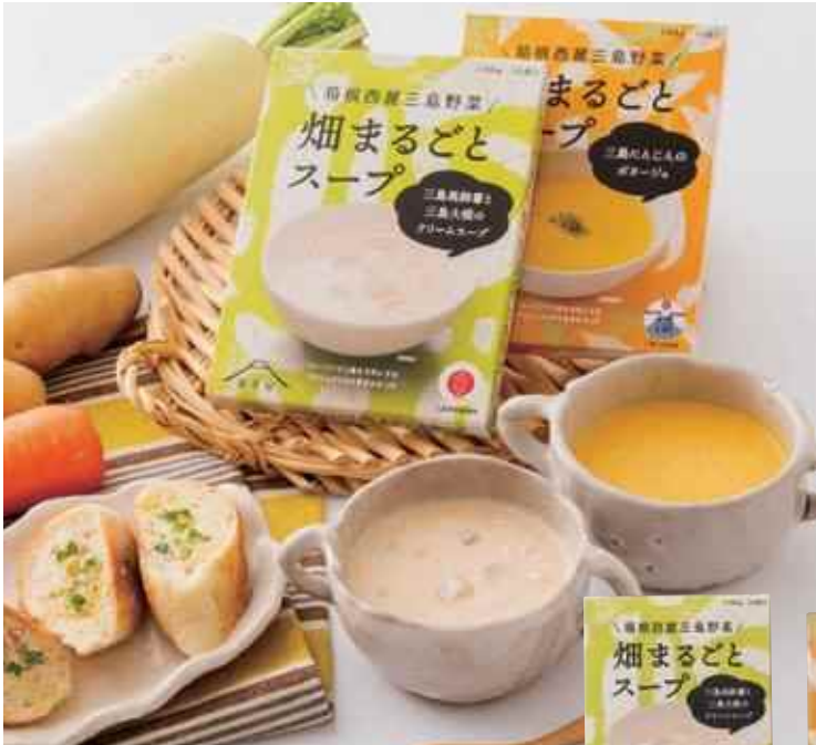
①三島馬鈴薯と三島大根のクリームスープ②三島にんじんのポターージュ / 内容量: 150g / 小売価格: 460円(税込) / 賞味期限: 製造から①24ヶ月②18ヶ月 / 保存方法: 常温 / 販売期間: 通年