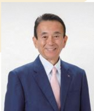
静岡県知事 鈴木 康友

多様な風土と温暖な気候に恵まれた静岡県は、産出額や出荷量で日本一を誇る茶や温州みかんをはじめ、わさび、温室メロン、生しいたけ、さくらえびなど、多彩で高品質な農林水産物が数多くあります。