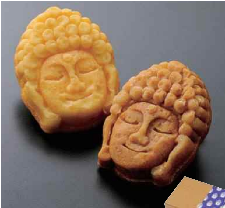
内容量: 12個(プレーン6個、キャラメル6個) / 小売価格: 2,160円(税込) / 賞味期限: 製造から40日 / 保存方法: 常温 / 販売期間: 通年